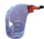
мерная бутылка для залива воды